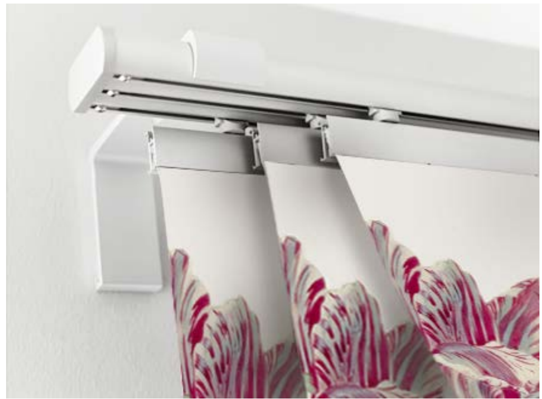
drie sporen rail

Er is keuze uit een enkel spoor of drie sporen rail, uitgevoerd in aluminium en op heel eenvoudige manier te monteren.