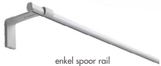
enkel spoor rail