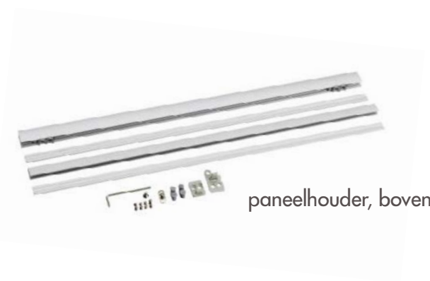
paneelhouder, boven en onder